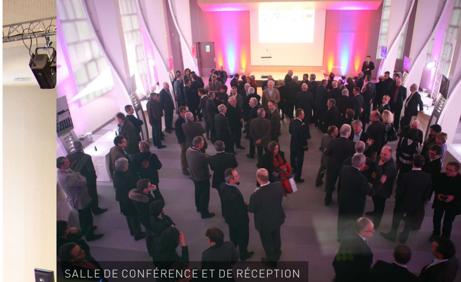
SALLE DE CONFÉRENCE ET DE RÉCEPTION

Depuis 1894, la CCI des Landes est le lieu privilégié où les chefs d'entreprise se rassemblent, échangent et rencontrent les forces vives du territoire.