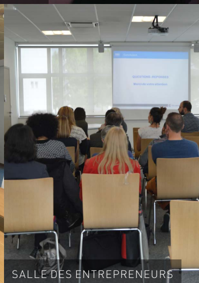
SALLE DES ENTREPRENEURS